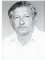
ವಲೇರಿಯನ್ ಡಾಯಸ್ ನಿಕಟ್ ಪೂರ್ವ್ ಅಧ್ಯಕ್