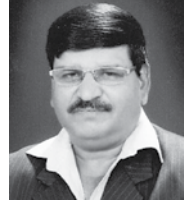
ಇಗ್ನೇಶಿಯಸ್ ಡಾಯಸ್ ರಾಜಕೀಯ್ ಸಂಚಾಲಕ್