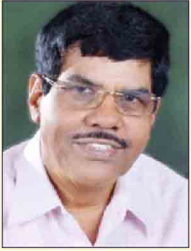
ಬರಯ್ಣಾರ್ ವಲ್ಲಿ ವಗ್ಗ