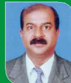
ಕ್ಷಿಪರ್ಡ್ ಸೋಜ್ ಮಡಂತ್ಯಾರ್